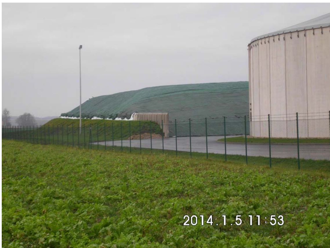
Abb. 3: Freilandsilo der Biogas Neutrebbin GmbH, Fundstelle des Dactylosternum abdominale (FABRICIUS, 1792)